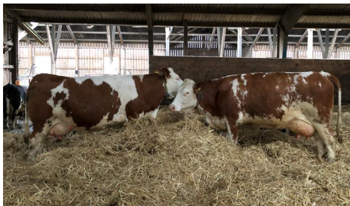
En tredjedel av gårdens kor är av rasen Fleckvieh. Alla kor går på djupströbädd på vintern.