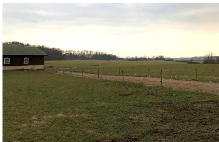
Runt gården finns det 70 ha bete för korna. Stabila fägator är centralt för att effektivisera kornas tid på betet.