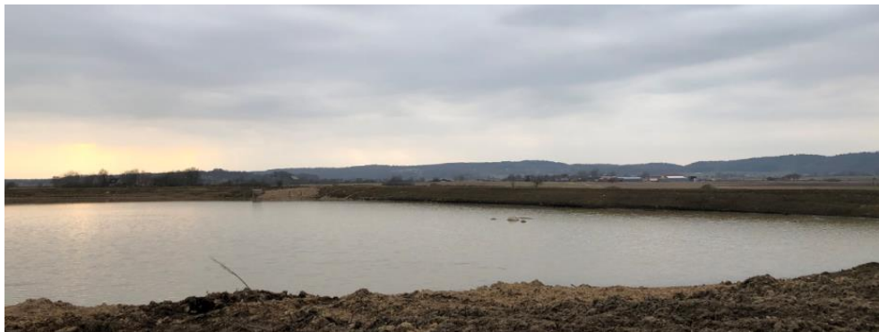
Kombinationsdamm: våtmark och bevattning.

För att optimera betesutnyttjandet än mer, har gården även säsongskalvning. Två tredjedelar av korna kalvar i oktober-december och en tredjedel mars-maj, så att alla mjölkar och är starka på sommaren.